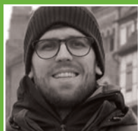
by Adrian Nussbaumer

„Ich war im Anlagengeschäft einer großen deutschen Bank tätig. Doch gerade im Anschluss an die Finanzkrise geschah vieles, das ich nicht verantworten konnte. Ich studiere nun an der Cusanus Hochschule für Gesellschaftsgestaltung, weil ich hier den Problemen wirklich auf den Grund gehen und ethisch begründete Handlungsspielräume entdecken kann. Weder die reine Praxis noch die verschulte Wissensvermittlung anderer Universitäten können mir dies bieten.“