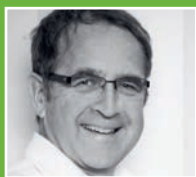
by Reinhard Loske

„Die Cusanus ist aus dem Geiste der Kritik geboren: Kritik an der Ökonomisierung immer weiterer Bereiche der Gesellschaft und Kritik an der mangelhaften historisch-philosophischen Fundierung und Pluralität der vorherrschenden Wirtschaftslehre. Nun geht es uns darum, aus der Kritik an den Verhältnissen auch ins Handeln zu kommen und zur Gesellschaftsgestaltung zu befähigen.“