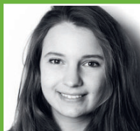
by Laura Porak

„Um den sozialen und ökologischen Herausforderungen unserer Zeit begegnen zu können, braucht es neue Konzepte. Die Cusanus Hochschule für Gesellschaftsgestaltung vermittelt nicht nur einen Einblick in bestehende ökonomische und philosophische Paradigmen, sondern fördert das eigenständige, kritische Denken, aus dem Neues entstehen kann. Das macht sie zu einem einzigartigen Bildungsort für mich.“